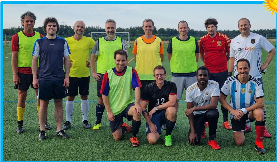
Freizeitmannschaft – FC Kick

Die Freizeitfußballer vom FC Kick trainieren montags von 19:30 bis 21 Uhr auf dem Kunstrasen, und freuen sich immer über neue Mitspieler.