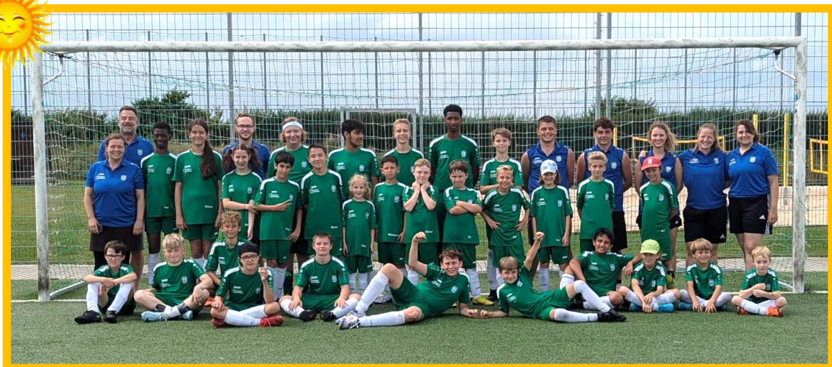
Gruppenbild vom Camp Inklusion