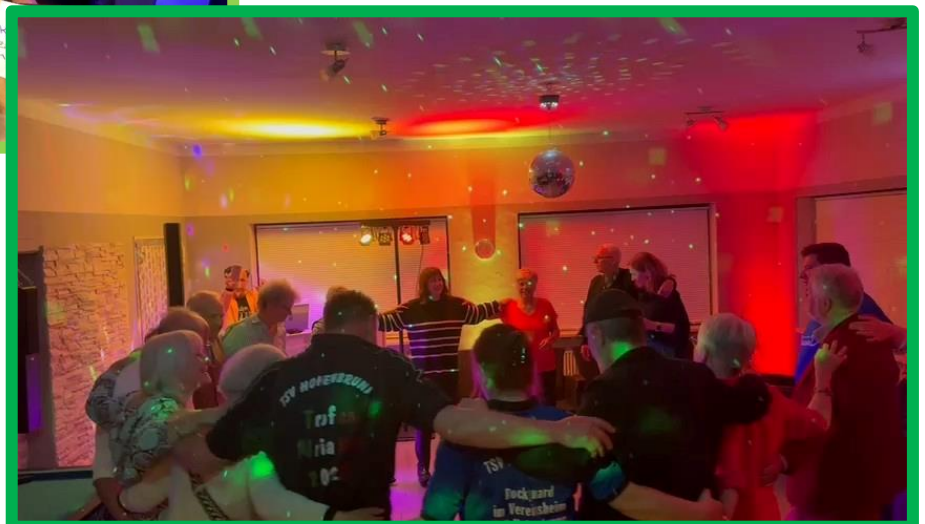
Volle Konzentration beim Sirtaki