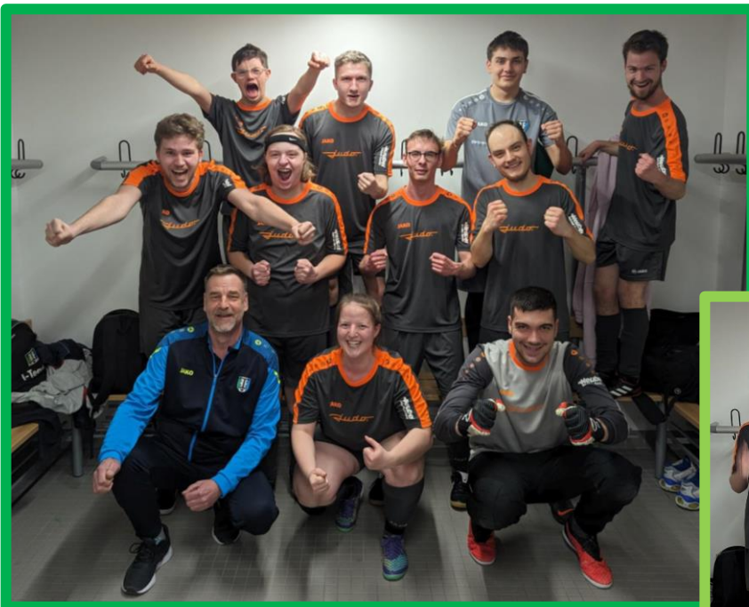
Ü16 Team Inklusion Die erfolgreiche Ü16 beim Hallenturnier des FC Espanol