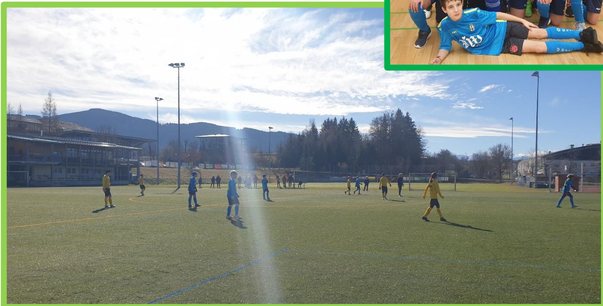
Freundschaftsspiel gegen den SV Bad Tölz, ein sehr ordentliches 2:2