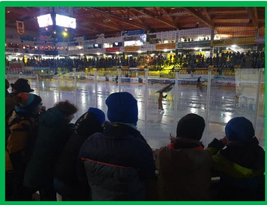
Besuch eines Eishockeyspiels der Tölzer Löwen